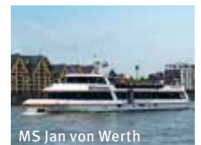
MS Jan von Werth